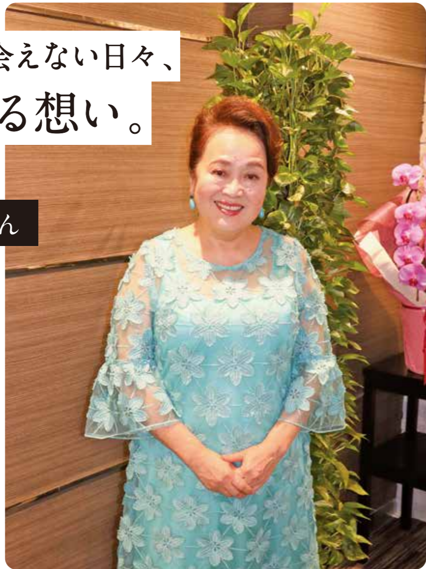
※このインタビューは2020年7月下旬にリモートにより実施しました。